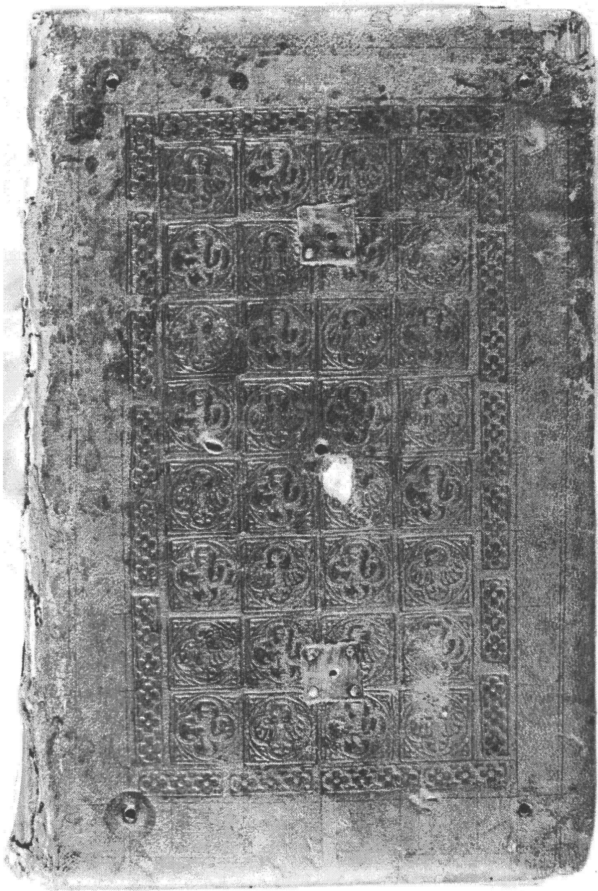
Il. 2. Anonimowy introligator z kręgu „Mistrza Księgi Przysięg”, oprawa modlitewnika biskupa Dobilsteina, Kolonia, prawdopodobnie 1375–1385. Stan przed konserwacją; Biblioteka UMK, Rps 100/I